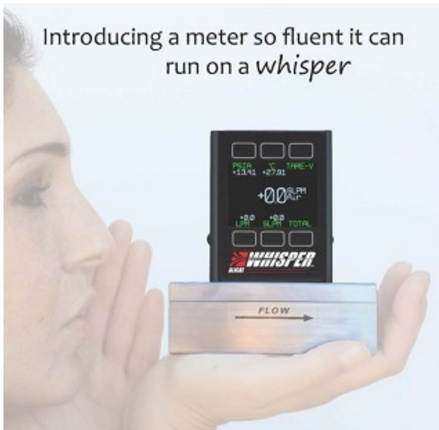
WHISPER 低圧力損失マスフローメーター