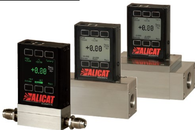
マスフローメーター