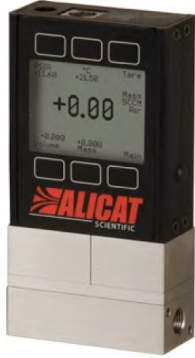
腐食性ガス/冷媒ガス対応マスフローメーター