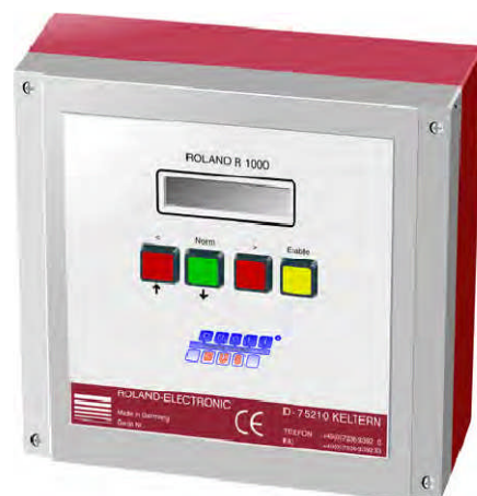
コントロールユニット